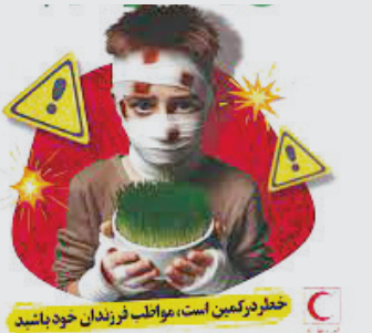
خطر همین است، مواظب فرزندان خود باشید

سرپرست شرکت نساجی هلال ایران از امضای قرارداد تولید اقلام ضروری سازمان امداد و نجات برای امداد رسانی در حوادث شامل ۲۰۰ هزار دستگاه جادار امدادی و مسافرتی، یک میلیون پتو و ۱۰ هزار تخته موکت در این شرکت ظرف ۶ ماه آینده خبر داد.