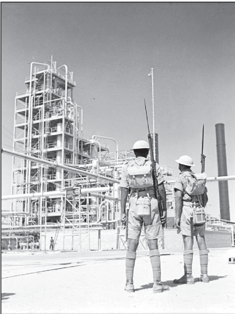
سربازان انگلیسی در پالایشگاه آبادان-۱۳۲۰