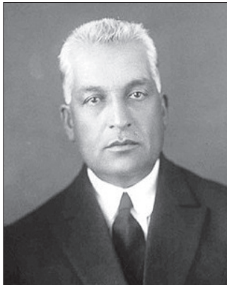
سید محمد تدین

برخی از تاریخ‌پژوهان خلع احمدشاه از فرماندهی کل قوا و هبه اختیارات نظامی کشور به رضاخان را حربه و سیاستی برای فرونشاندن عطش قدرت‌طلبی او عنوان می‌کنند. کمالین که می‌بینیم برخی از نمایندگان موجه مجلس همچون سید حسن مدرس و محمد مصدق، نه تنها مخالف نیستند که به نوعی از آن حمایت نیز به عمل می‌آورند. امثال مدرس و مصدق به دلیل آشنایی با روحیات رضاخان، نگران بودند که او پس از مشاهده مقاومت مجلس بازی قدرت را برهم‌زنند و با یک کودتا خود به تنهایی در رأس همه امور قرار گیرد. در حقیقت اعطای فرماندهی کل قوا هدیه‌ای بود برای مهار یک کودک بهانه‌گیر و لوجج، هر چند که در نهایت این ترفند کارگر نیفتاد و عطش رضاخان را برای تصاحب قدرت مطلق در کشور بیشتر کرد. نهایتاً نیز در تاریخ ۲۱ آذر ۱۳۰۴ خورشیدی سلطنت ایران به رضاخان واگذار شد و مراسم تاجگذاری نیز ۴ اردیبهشت ۱۳۰۵ انجام شد.