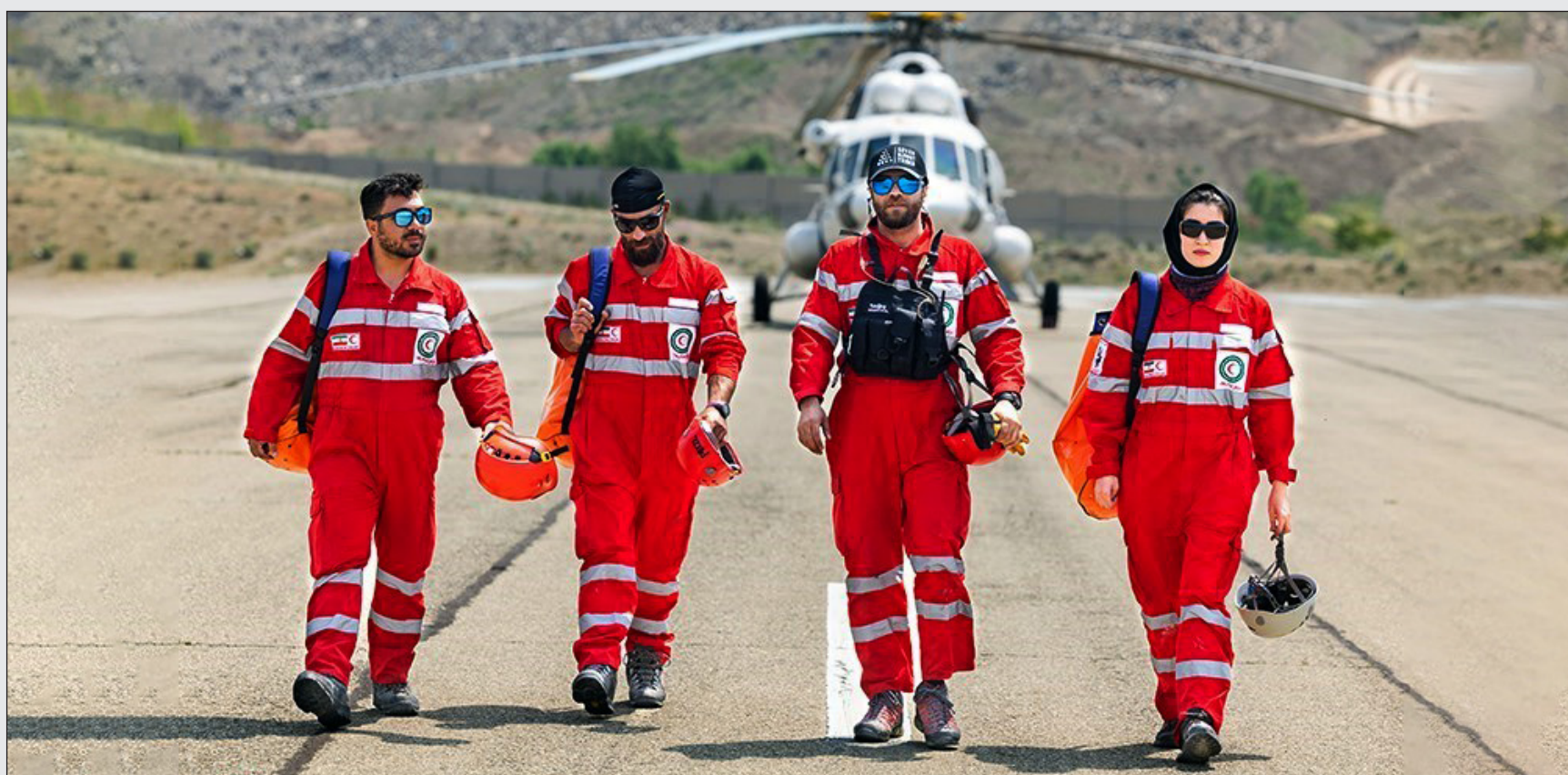
قوی ترین سازمان امداد و نجات دنیا را بشناسید