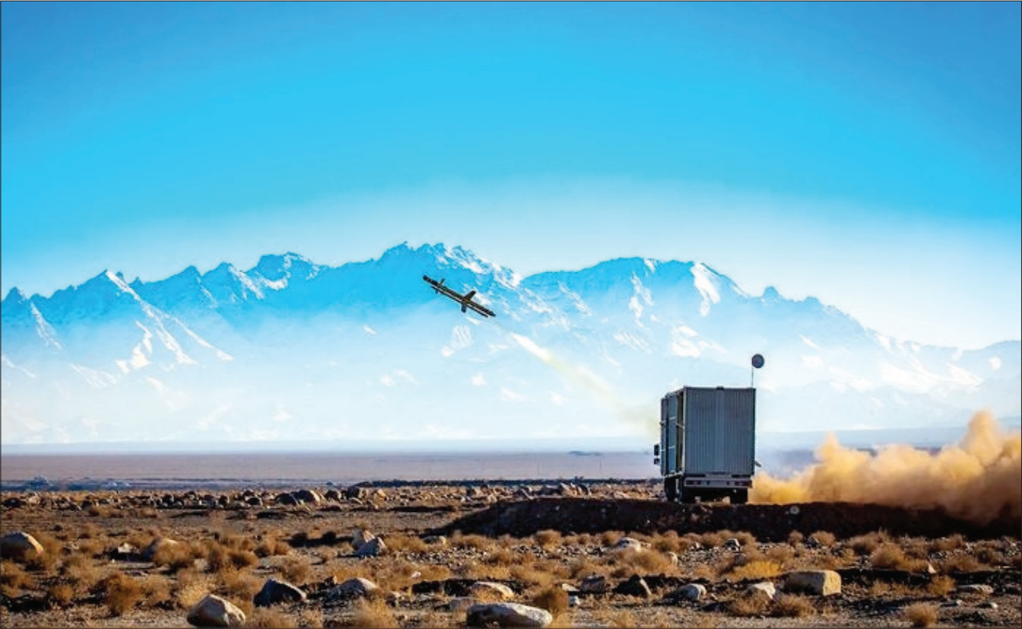
سامانه پدافندی ۳۵۸ برای نخستین بار در زمایش پیامبر اعظم ۱۹ سپاه پاسداران رونمایی شد

رئیس کل گمرک ایران گفت: ارزش تجارت خارجی ایران با کشورهای عضو اتحادیه اوراسیا از ابتدای امسال تا پایان آذرماه به ۲ میلیارد و ۷۰۴ میلیون دلار رسیده است. فرود عسگری با ارائه گزارشی از جزئیات صادرات و واردات ایران با کشورهای عضو اوراسیا اظهار داشت: ارزش صادرات ایران به کشورهای اوراسیا حدود یک میلیارد و ۴۹۲ میلیون و ۸۳۹ هزار دلار است که در مقایسه با مدت مشابه با سال رشد ۲۰۷۹ درصدی را نشان می‌دهد. وی افزود: وزن صادرات صورت گرفته در این مدت نیز سه میلیارد و ۸۵۷ میلیون کیلوگرم برآورد شده که نسبت به مدت مشابه سال گذشته از لحاظ وزنی ۲۱۰۶۹ درصد رشد را ثبت کرده است. رئیس کل گمرک ایران ادامه داد: بیشترین سهم صادرات ایران به ترتیب به فدراسیون روسیه، ارمنستان و قزاقستان صورت گرفته است. وی با اشاره به وضعیت واردات ایران با پنج کشور عضو اتحادیه اوراسیا گفت: در ۹ ماه امسال کل واردات یک میلیارد و ۲۰۹ میلیون دلار است که نسبت به مدت مشابه سال گذشته که یک میلیارد و ۴۹۵ میلیون دلار بود، کاهش ۱۶ درصدی را نشان می‌دهد.