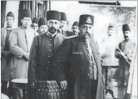
مظفرالدین شاه در مراسم افتتاح اولین مجلس شورای ملی

شاه بی علاقه به اعمال قدرت اما عاشق فرنگستان امضای فرمان مشروطیت آن هم با وجود مخالفت رجال سرشناس و گردن کلفتی چون علی اصغرخان انابیک صدر اعظم و همچنین عبدالعزیز عین الدوله حاکم تهران، کار کوچکی نبود، آن هم با وجود کسالت مزاج مظفرالدین شاه که در این دوران سخت تر شده و می توانست اراده او را تحت تاثیر خود قرار دهد. در این دوران حتی زمزمه هایی مبنی بر لزوم کناره گیری شاه به دلیل بیماری و سپردن زمام امور به ولیعهد (محمدعلی میرزا) در گوشه و کنار دربار شنیده می شد، اما مظفرالدین شاه با این استدلال که بار تکلیف فوق برای ولیعهد زیاده از حد سنگین است، مسئولیت پذیرش مشروطیت را یک تنه بر عهده گرفت تا حداقل در این مورد به خصوص، نامی نیک از خود در تاریخ به یادگار بگذارد. پنجمین شاه قاجار بر خلاف اسلاف خود علاقه زیادی به اعمال قدرت و خونریزی نداشت که این البته بی ارتباط با زنجوری اش نبود. آنچنان که در تاریخ آمده او حتی مایل به قصاص میرزا رضا کرمانی قاتل پدرش هم نبود و به دلیل فشار درباریان راضی به آن شد. البته مظفرالدین شاه نیز همچون پدرش علاقه وافری به سفر فرنگ داشت که دستاورد آن برای کشور چیزی جز قرض و بدهی خارجی نبود.