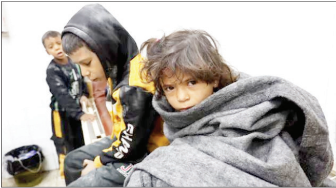
کودکان زخمی فلسطینی پس از حمله اسرائیل به مدرسه موسی بن نصیر در غزه (محل اسکان فلسطینی‌های آواره) به بیمارستان «بانیست الاهلی» در شمال غزه آورده شدند.

📄 [شهروند] به گزارش رسانه انگلیسی «گاردین»، وزارت بهداشت غزه اعلام کرد که سه بیمارستان اصلی در شمال غزه -که کمال عدوان یکی از آنهاست- به سختی کار می‌کنند و از زمانی که اسرائیل تانک‌هایش را در ماه اکتبر به بیت لاهیا، بیت حانون و جبلیا فرستاده، بارها هدف حمله قرار گرفته‌اند. ارتش اسرائیل مدعی است که هدف از حمله مجدد به شمال غزه، مقابله حماس در آنجاست. اما اسرائیل به بیمارستان‌ها و پناهگاه‌ها حمله کرده و بسیاری از غیرنظامیان در میان حملات بی‌امان جان باخته‌اند. آژانس دفاع غیرنظامی غزه اعلام کرد که حملات هوایی اسرائیل در شب و صبح دیروز منجر به جان باختن دست‌کم ۲۸ فلسطینی شده است. ۸ نفر از جمله ۴ کودک در حمله به مدرسه موسی بن نصیر که پناهگاه فلسطینی‌های آواره بود، جان دادند.