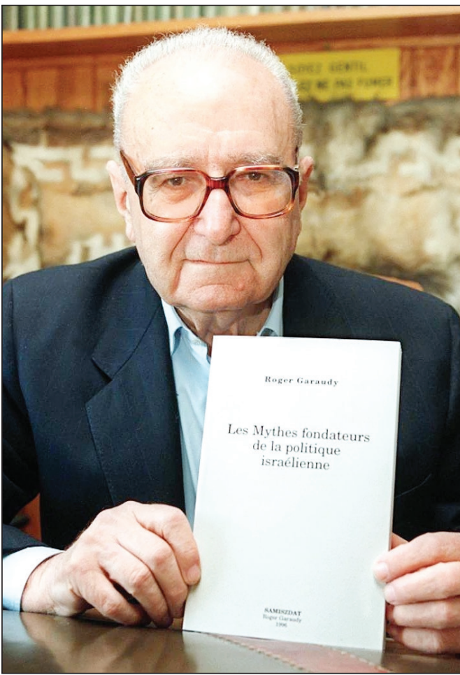
گارودی و کتابی با عنوان «اساطیر بنیان‌گذار سیاست اسرائیل»