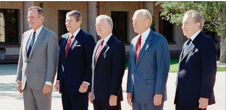
از راست: نیکسون، جانسون، کارتر، ریگان و بوش

نفر چهارم فهرست جیمی کارتر است که بحران گروگان‌گیری در ایران تأثیر بدی بر محبوبیت او داشت و آن را به ۲۸ درصد رساند. جورج اچ. دبلیو. بوش (پدر) هم با ۲۹ درصد رتبه پنجم قرار دارد. رتبه ششم اما به دونالد ترامپ تعلق دارد با ۳۴ درصد محبوبیت، هرچند رکورد بیشتری از محبوبیت او نیز ۴۴ درصد بیشتر نیست. نفر هفتم لیندون بی. جانسون است با ۳۵ درصد محبوبیت که عاملی جز جنگ ویتنام نداشت. رونالد ریگان نیز کار خود را با محبوبیتی بالا آغاز کرد، اما رکود اقتصادی و بی‌کاری در صد محبوبیت او را به رقم ۳۵ درصد زدیک کرد. نفر نهم فهرست جرالد فورد است که پس از رسوایی واترگیت و استعفا ریچارد نیکسون وارد کاخ سفید شد و به دلیل عفونی‌نکسون با محبوبیت ۳۷ درصد کار خود را تمام کرد. رتبه دهم اما به بیل کلینتون اختصاص دارد که پس از رسوایی رابطه با مونیکا آلونسکی محبوبیت او به ۳۷ درصد رسید.