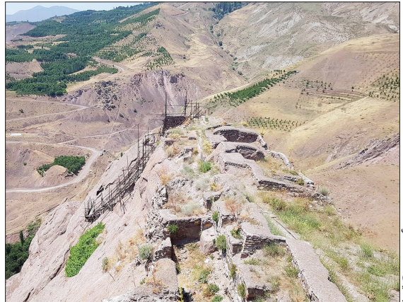
تاریخ قلعه الموت