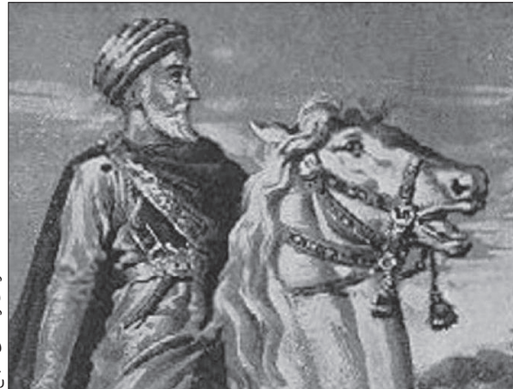
نگاره‌ای از حسن صباح

اشغال قلعه الموت به‌عنوان قدیمی‌ترین و مستحکم‌ترین دژ اسماعیلیان که افسانه‌های بسیاری درباره غیرقابل تسخیر بودن آن ساخته بودند، سقوط دیگر قلعه‌های اسماعیلیه در قهستان (خراسان)، دیلمان (گیلان)، طارم (زنجان) و لار (فارس) را به دنبال داشت. همانطور که ذکر شد اسماعیلیان نخستین بار توسط حسن صباح به قدرت رسیدند. پس از او ۷ جانشین آمدند که آخرین آن‌ها رکن‌الدین خورشاه توسط هلاکوخان به بند کشیده شد و در راه مغولستان به قتل رسید. تاریخ اسماعیلیان و بنیان‌گذار سلسله‌شان «حسن صباح» جدای از حقایق تاریخی،