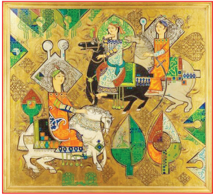
آثار هنرمندان ایرانی در ژنو چکش خورد