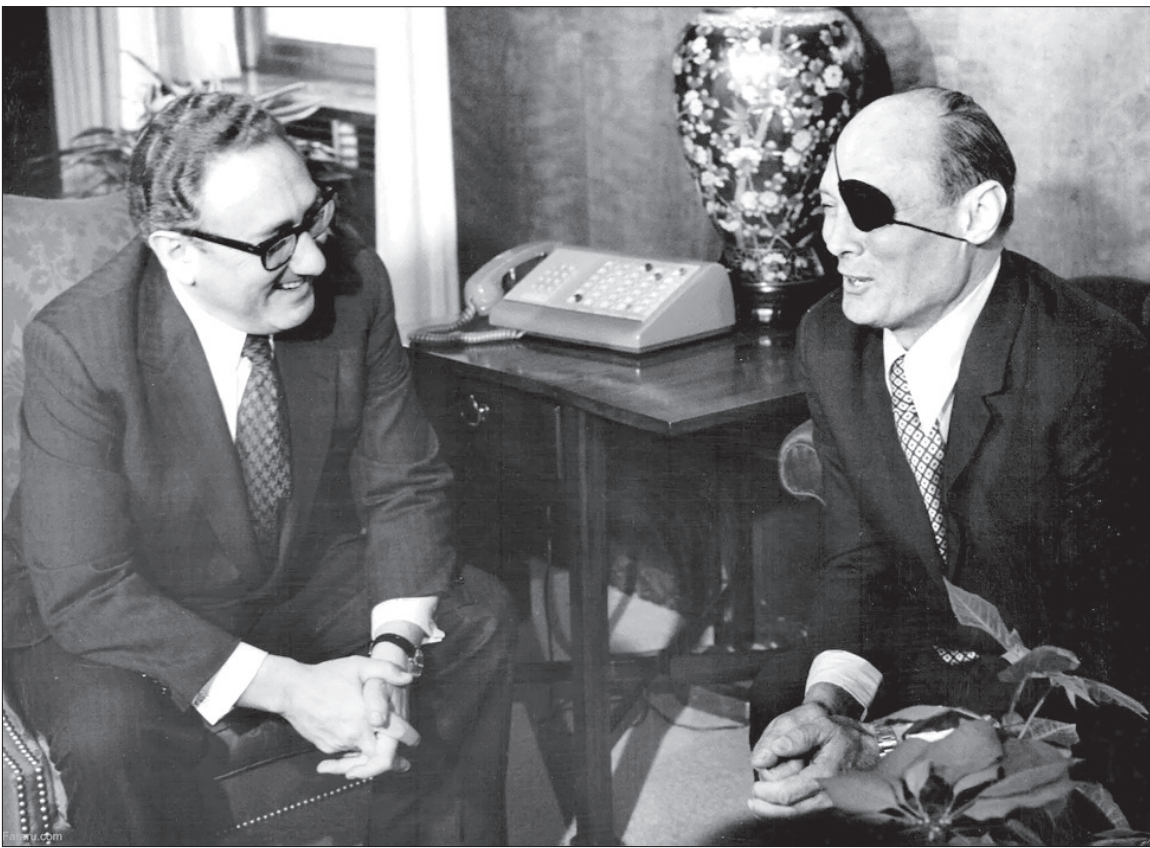
کیسینجر در کنار موشه دایان وزیر جنگ اسرائیل