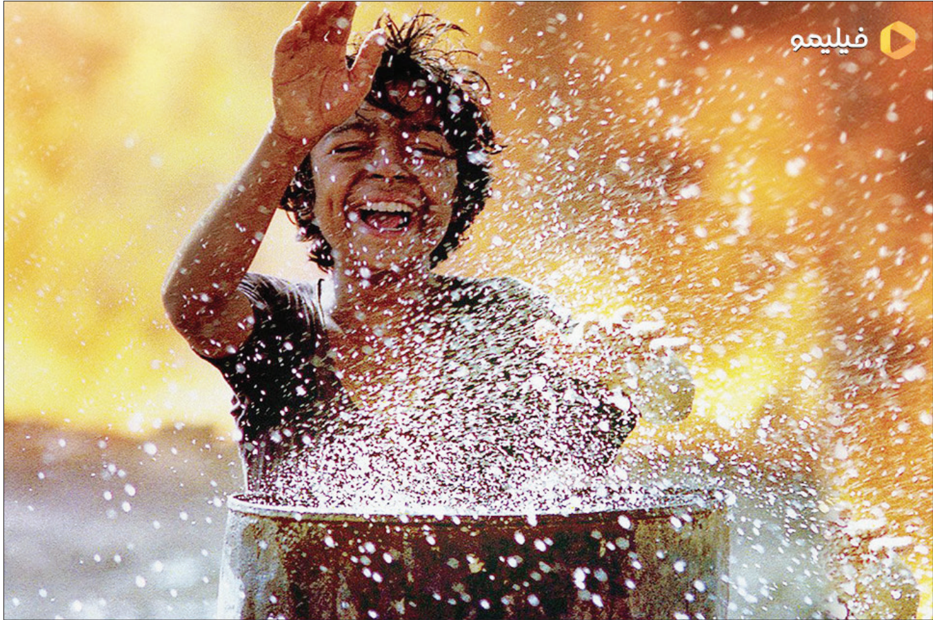
دوید ساجه امیر ناری یکی از موفق ترین فیلم‌های تاریخ کانون پرورش فکری کودکان و نوجوانان بوده است