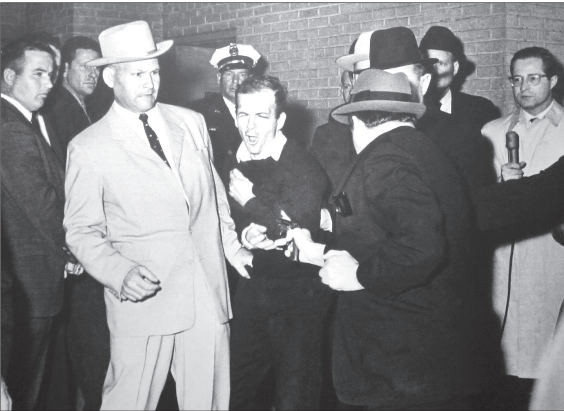
لحظه شلیک به اسوالد