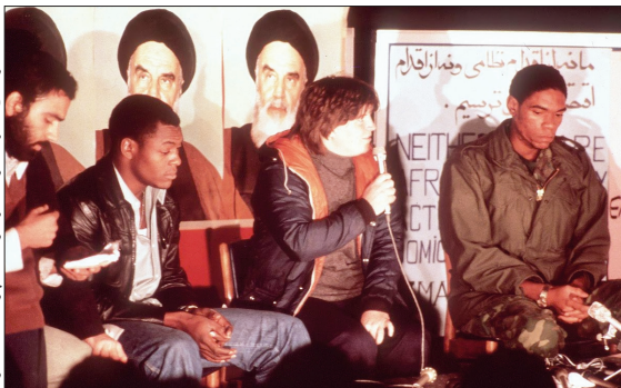
گزارش خبری کارکنان زن و سیاهپوستان سفارت

۴۵ سال پیش در چنین روزی، برابر ۲۷ آبان ۱۳۵۸ خورشیدی، ۱۵ روز پس از تسخیر سفارت آمریکا در تهران توسط دانشجویان، امام خمینی (ره) با صدور پیامی که در ابتدای این متن آمد، ضمن تأیید این حرکت انقلابی و تأکید بر لزوم پاسخگویی آمریکایی‌ها در قبال جنایات