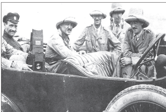
نظامیان انگلیسی در ایران

۱۹ سال پیش در چنین روزی، برابر ۲۳ آبان ۱۲۹۶ خورشیدی، مجلس سوم شورای ملی در اعتراض به ادامه اشغال ایران اعلام انحلال کرد و رسماً به کار خود پایان داد. در این ایام حدود یک سال از اشغال ایران توسط قوای روس و انگلیس می‌گذشت و دولت ایران کوچکترین اختیاری برای تصمیم‌گیری در خصوص مسائل اساسی کشور نداشت. فقط یک نمونه از این بی‌اختیاری را می‌توان در اختصاص دادن حجم قابل توجهی