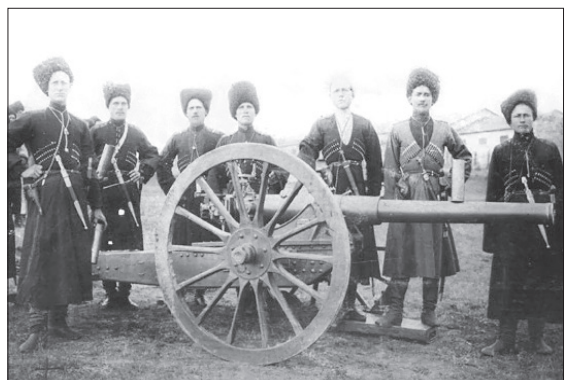
نظامیان روس در ایران