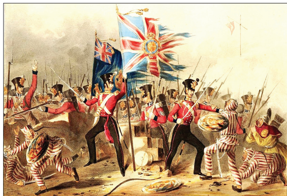
نگاره‌ای از جنگ تریاک