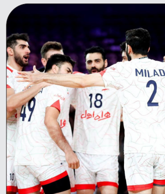
دلمان برای این تیم تنگ شده بود

نصرالله در بخش های پایانی سخنان خود با خنثی کردن جنگ روانی صهیونیست ها عنوان کرد: «وزارت جنگ دشمن می گوید که ۸۶۳ تن از افسران و سربازانش دچار معلولیت شده اند و ما می پرسیم که تعداد مجروحان آنها چقدر است؟ دشمن تعداد زیادی از پایگاه های نظامی خود را در مرزهایش با جنوب لبنان تخلیه کرده است. مقاومت اطلاعات جدید و دقیقی را در مورد پایگاه های دشمن اسرائیلی در مرزها به دست آورده است. ما در مقابل حقیقتی بسیار مهم قرار داریم که غزه و کرانه باختری در حال ترسیم آن هستند و خسارت های بزرگی وجود دارد که به رژیم صهیونیستی وارد می شود. از هشتم اکتبر دشمن فهمید که پایگاه های هدف قرار خواهد گرفت و ما اطلاعات کافی در مورد آنها و در مورد استحکامات و سازوبرگ و نفرت آنها داریم. ما بر اساس برنامه معین و مشخص به حمله به مواضع دشمن ادامه می دهیم.» /فارس