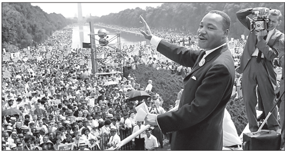
مارتین لوتر کینگ

مارتین لوتر کینگ جوانی، ۹۵ سال پیش در چنین روزی، برابر ۱۵ ژانویه ۱۹۲۹ میلادی در شهر آتلانتای ایالت جورجیا به دنیا آمد. چیزی که این مرد سیاهپوست را ظرف یک دهه به رهبر جنبش حقوق مدنی آمریکایی‌های آفریقایی‌تبار تبدیل کرد، تبعیض نژادی سیستماتیک در اکثر قریب به اتفاق ایالت‌های آمریکا بود. تبعیضی که در جزئی‌ترین موارد مثل جداسازی محل نشستن سفیدپوستان و سیاهپوستان در اتوبوس‌های شهری نیز به مورد اجرا گذاشته می‌شد. برای منفجر شدن این حجم عظیم از حس تحقیر که در جامعه سیاهپوستان آمریکا انباشته شده بود، تنها یک جرقه کافی بود. زلزله پارکس، زن سیاهپوست اهل آلاباما، با نشستن روی صندلی مخصوص سفیدپوستان در یک اتوبوس شهری نخستین شعله را روشن کرد. بازداشت پارکس توسط پلیس در اول دسامبر ۱۹۵۵ میلادی، طغیان سیاهپوستان سراسر آمریکا را در پی داشت و مارتین لوتر کینگ با به دست گرفتن پرچم این اعتراض‌ها خیلی زود به عنوان لیدر جنبش حقوق مدنی آمریکایی‌های آفریقایی‌تبار در خط مقدم مبارزه با نژادپرست‌ها قرار گرفت. پرچم لوتر کینگ مدت‌هاست بر زمین افتاده، هرچند ادامه اتفاقاتی چون قتل جرج فلویید، عاقبت به ظهور مناسب‌ترین فرد برای برافراشتن مجدد آن خواهد انجامید.