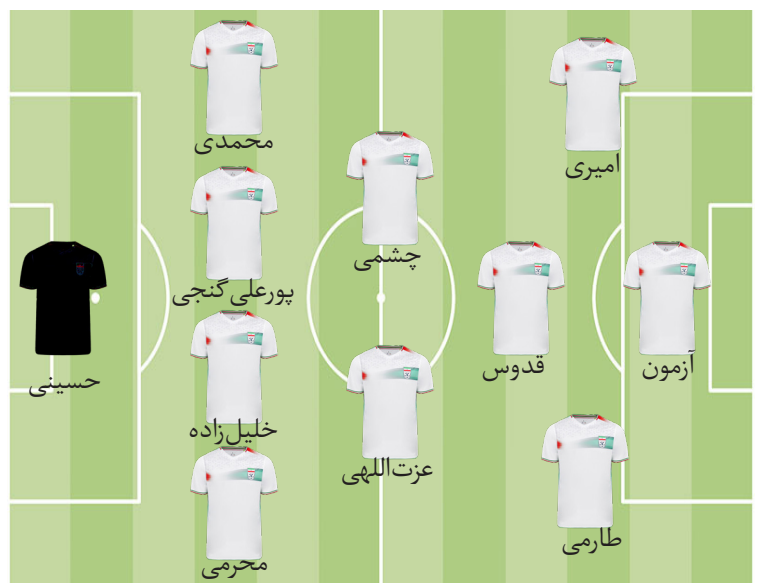
ترکیب احتمالی ایران برای بازی با ولز

خداداد عزیز، پیشکسوت فوتبال | در این چند روز، آنقدر همه دوستانم درباره ترکیب اشتباه کارلوس کی‌روش صحبت کرده‌اند که من نمی‌خواهم این حرف را دوباره تکرار کنم. بروا واضح است که کی‌روش استراتژی اشتباهی برای بازی با انگلیس انتخاب کرد و نفراش را به زمین فرستاد که بازی‌شان قابل توجیه نبود. این اشتباه بزرگ، یک شکست مرگبار را رقم زد. جدا از اینکه سرمربی تیم ملی هیچ توضیحی به مردم ایران درباره این شکست ارائه نکرد، اما واقعاً دلیل این همه تغییر در ترکیب را هنوز هم نتوانسته‌ام هضم کنم. تیم ملی ایران در زمان سرمربیگری درآگان اسکوچیچ از نظر شکل ترکیب و سیستم بازی مشکلی نداشت.