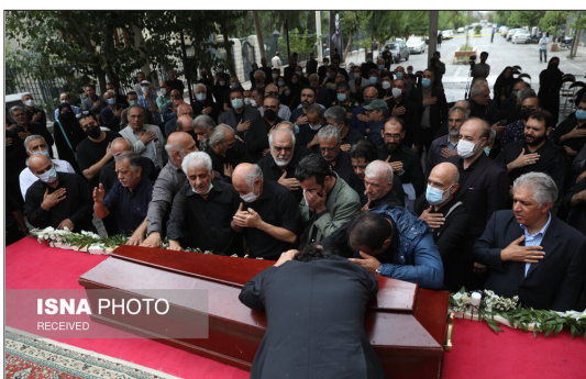
ایسنا- مراسم تشییع پیکر حبیب‌الله صادقی، روز گذشته با حضور شخصیت‌های فرهنگی و هنری برگزار شد.