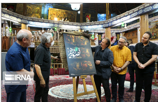
ایرنا- مراسم رونمایی از پوستر سوئمن سوگواره «تصویر دهم» صبح دیروز با حضور مجید مجیدی، مدیر رویداد و جمعی از کارگردانان و بازیگران سینما در تکیه نیاوران برگزار شد.