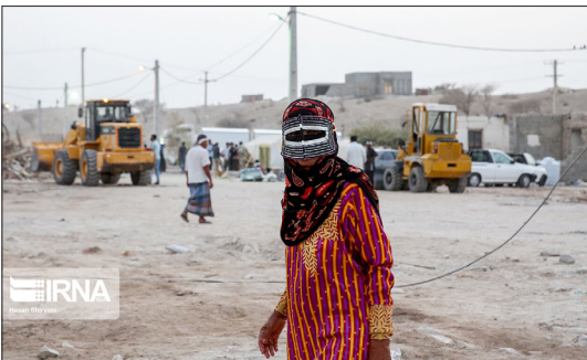
ایرنا- باگذشت سه روز از زمین لرزه ۶.۱ ریشتری در استان هرمزگان و با وجود پس لرزه های مختلف در این مناطق، فعالیت امداد رسانی و آواربرداری در روستاهای اطراف بندر خمیر ادامه دارد.