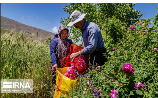
ایرنا- دهمین جشنواره برداشت گل محمدی با حضور جمعی از مسئولان و گردشگران در روستای عسرو در دامنه رشته کوه سهند، از توابع شهرستان اسکو برگزار شد.