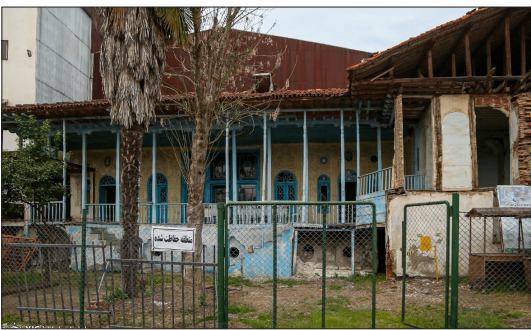
باشگاه خبرنگاران جوان - «خانه تاریخی آوانسیان» در سال ۱۸۹۵ میلادی توسط خاندان آوادیس هوردانانیان ساخته شد. در سال ۱۹۰۵ میلادی به تملک آوانس آوانسیان درآمد که سال ها در تملک آن خاندان بود و پس از آن، اداره کل ارشاد اسلامی بنای مورد نظر را خریداری کرد. در زمستان سال ۱۳۸۳ به علت ریزش برف سنگین، سقف این بنا آسیب دید. هم اکنون ورود افراد به این ساختمان ممنوع است. سال هاست زلزله های بازسازی این بنا بدون اقدام عملی به گوش می رسد.