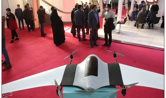
تسنیم - نمایشگاه ایران ژئو نخستین نمایشگاه حوزه اطلاعات مکانی است که روز پنجشنبه در محل سالن خلیج فارس نمایشگاه بین المللی تهران آغاز به کار کرد.