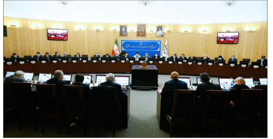
مهمترین تصمیمات کمیسیون تلفیق لایحه بودجه ۱۴۰۱