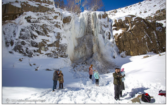
باشگاه خبرنگاران جوان - آبشار گنجانم با ۱۲ متر ارتفاع در مسیر صعود به ارتفاعات کوه الوند در پنج کیلومتری غرب همدان کنار کتیبه های گنجانم قرار دارد. این آبشار دارای آب دائمی است و در زمستان ها نیز در جریان است. در پی بارش های زمستانی چند روز اخیر و برودت هوا، آبشار گنجانم همدان متجمد شد و جلوه زیبایی برای گردشگران ایجاد کرد.