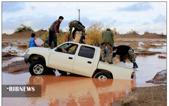
واحد مرکزی خبر - استاندار کرمان اعلام کرد: ۶۰ بالگرد، امداد رسانی هوایی در مناطق سیل زده استان داشتند و گروه های آفرود نیز در منطقه حضور یافتند. او افزود: «باتلاق ایجاد شده در دشت جازموربان باعث می شود که نتوانیم با خودرو به کمک مردم برویم.» او با یادآوری اینکه منطقه جنوب استان کرمان یک منطقه سیل خیز است، گفت: «حجم بارندگی های اخیر بسیار زیاد و شدید بود و به گفته ساکنان منطقه بی سابقه بوده است. نیروهای امدادی، بسج و وسپا در منطقه مستقر شده اند که به محض فرود آمدن آب امداد رسانی آغاز شود.»