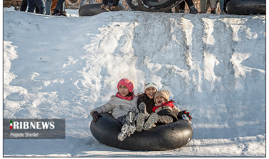
واحد مرکزی خبر - در پی فعالیت یک سامانه بارشی در استان همدان، ارتفاع برف در برخی از نقاط استان همدان به ۲۰ سانتی متر رسیده است. بارش برف پس از گذشت حدود یک ماه از فصل زمستان در همدان موجب حضور مردم در کوه و خیابان ها و شادی آنها شد. در دامنه کوه الوند به علت بارش برف، جمعیت زیادی برای تفریحات مختلفی مانند تیوب بازی و برف بازی جمع شده اند.