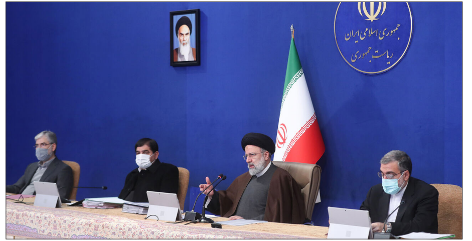
رئیس جمهوری در جلسه ستاد تنظیم بازار خواستار شد