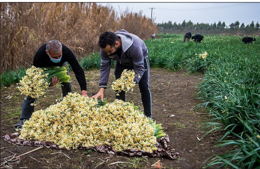
تسنیم- در سال ۱۴۰۰ میزان ۹۰ هکتار از زمین‌های کشاورزی استان مازندران گل‌های نرگس کشت شده که سهم ساری ۱۵ هکتار می‌باشد. جویبار با بیش از ۶۵ هکتار سطح کشت، بیشترین سهم از برداشت گل نرگس در مازندران را داراست.