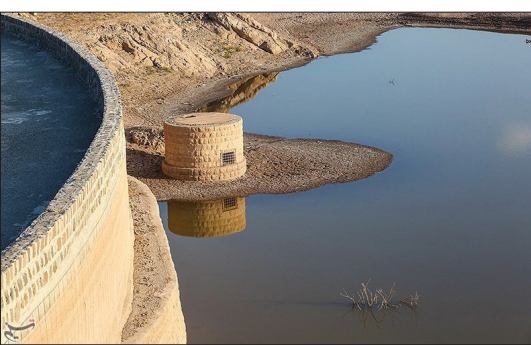
تسنیم- سد قوسی، وزنی «کبار» قم که به عنوان یکی از قدیمی‌ترین سد‌های قوسی جهان شناخته می‌شود، در حدود بیست کیلومتری شهر قم قرار دارد. ارتفاع این سد ۲۶ متر و طول ۵۵ متر، دارای یک برج آبگیر است که با قدمتی تاریخی نقش مهمی در کشاورزی منطقه ایفا نموده است. مخزن این سد که در بارش‌های سال ۱۳۹۸ به صورت کامل پر شده بود، با کاهش بارش در سال‌های اخیر، این روزها در وضعیت نگران‌کننده‌ای به سر می‌برد.