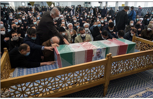
تسنیم- مراسم تشییع شهید حسن ایرلو، سفیر جمهوری اسلامی ایران در یمین و جانباز سرافراز دوران دفاع مقدس صبح دیروز (چهارشنبه ۱ دی) از مقابل مسجد پیامبر اعظم (ص) واقع در شهرک شهید محلاتی برگزار شد.