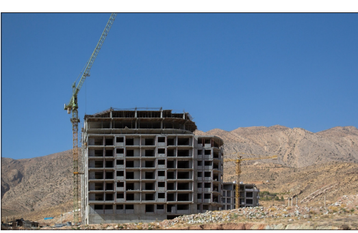
باشگاه خبرنگاران جوان - شهر شیراز با توجه به اینکه جزء پنج کلانشهر ایران است اما از هوایی پاک برخوردار است، متأسفانه در سال‌های اخیر شاهد ساخت وسازهای فراوان در دامنه کوه‌های اطراف شیراز از جمله کوه دراک که ورودی اصلی هوای پاک به این شهر است، هستیم و با توجه به موقعیت جغرافیایی شیراز و قرارگیری آن در دشت، اگر این ساخت وسازهای بی‌رویه ادامه پیدا کند در آینده‌ای نه چندان دور شاهد وارونگی و آلودگی هواد کلانشهر شیراز هم خواهیم بود.