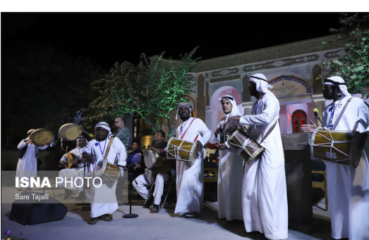
ایسنا- چهاردهمین جشنواره موسیقی نواحی ایران پس از چهار روز برگزاری، با حضور سرپرست معاونت هنری وزارت فرهنگ و ارشاد اسلامی در محل باغ موزه وزیری شهر کرمان به کار خود خاتمه داد. در این آیین سرپرست معاونت وزارت فرهنگ و ارشاد اسلامی با استقرار دبیرخانه دائمی این جشنواره در کرمان موافقت کرد.