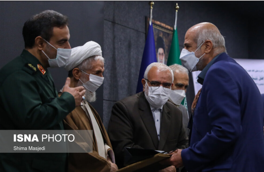
ایسنا- همایش ملی ایران مهربان با حضور برخی از مسئولین و خیرین دوشنبه ۳ آبان ماه در دفتر مرکزی کمیته امداد امام خمینی (ره) برگزار شد.