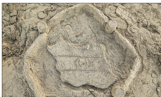
باشگاه خبرنگاران جوان - جشنواره نگاره های ماسه ای با استقبال خانواده ها صبح دیروز جمعه ۲۰ مهر ۱۴۰۰ در ساحل شهر بوشهر برگزار شد.