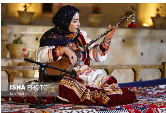
ایسنا- چهاردهمین جشنواره موسیقی نواحی ایران شامگاه پنجشنبه ۲۹ مهرماه با حضور استاندار کرمان در محل باغ موزه وزیری این شهر آغاز به کار کرد. جشنواره موسیقی نواحی ایران با شعار وحدت در کثرت اقوام از ۲۹ مهر تا ۲ آبان ماه به صورت غیرقانونی برگزار می شود.