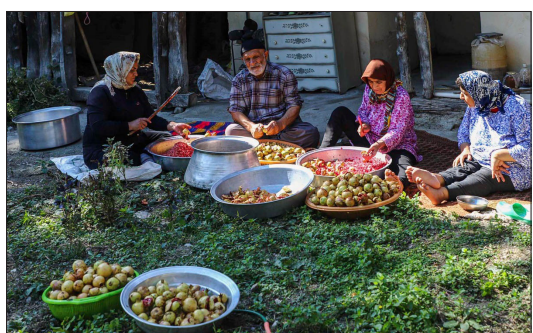
باشگاه خبرنگاران جوان - حدود ۶ هزار هکتار انارستان در استان کویری یزد وجود دارد که بخش عمده آن در شهرستان های میبد، اردکان، یزد، تفت و ابرکوه ایجاد شده و از ۴ رقم انار که در این استان تولید می شود، ۱۱ رقم آن مرغوبیت لازم را برای صادرات دارد. انار فقط مخصوص استان یزد نیست، برداشت انار و حشی از انارستان های جنگلی گلستان و تهیه رب انار به عنوان پرطرفدارترین چاشنی غذایی، از جمله فعالیت های روستائینان این خطه شمالی در روزهای نخست پاییز است.