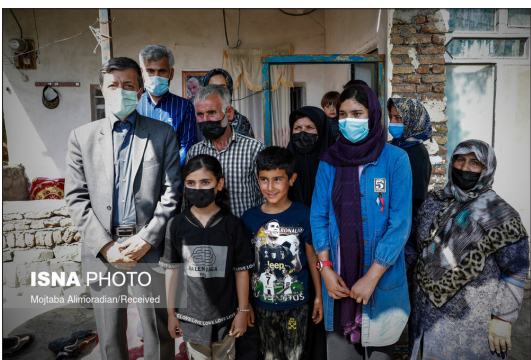
ایسنا- پرویز فتح، رئیس بنیاد مستضعفان، پنجشنبه ۲۵ شهریور در دومین روز از سفر به استان اردبیل، از مراحل ساخت سد عمارت بازدید کرد و در ادامه با حضور در یک روستای مرزی در منطقه محروم گرمی به همراه علی نیکزاد نایب رئیس مجلس و مرتضی بختیاری رئیس کمیته امداد، عملیات اجرایی احداث ۱۰ هزار واحد مسکونی برای مددجویان کمیته امداد را کلید زد.