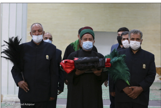
باشگاه خبرنگاران جوان - هجدهمین اجلاس بین المللی تجلیل از پیرغلامان و خادمان حسینی با حضور رئیس سازمان صداوسیما جمهوری اسلامی ایران و مسئولان استانی در تبریز به کار خود خاتمه داد.