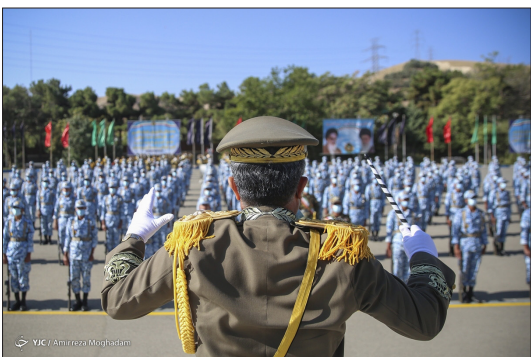
باشگاه خبرنگاران جوان - آیین اختتامیه نوزدهمین دوره رزم قدمتی مشترک جامعه پذیرد دانشجویان دانشگاه های افسری ارتش با حضور امیر سرلشکر سید عبدالرحیم موسوی فرمانده کل ارتش جمهوری اسلامی ایران، در مرکز آموزش حضرت جواد الائمه نیروی زمینی ارتش برگزار شد.