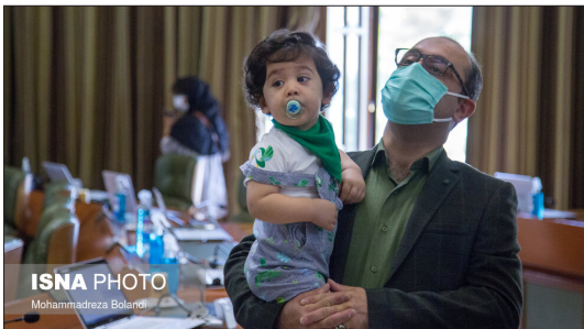
ایسنا- در حاشیه آخرین جلسه شورای پنجم شهر تهران که سه شنبه ۱۲ مرداد به ریاست محسن هاشمی‌رفسنجانی و پیروز حناچی، شهردار تهران برگزار شد.