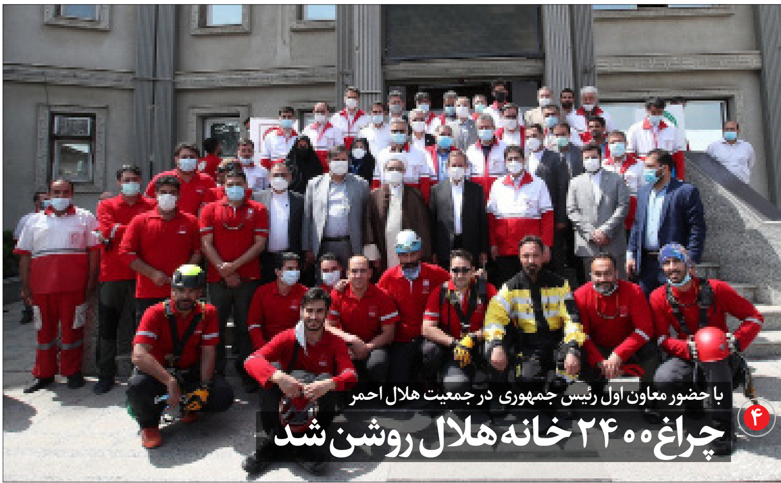
با حضور معاون اول رئیس جمهوری در جمعیت هلال احمر چراغ ۲۴۰۰ خانه هلال روشن شد