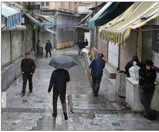
ایرنا - تهران - محدودیت‌های کرونایی با تصمیم ستاد ملی کرونا، از اول آذرماه به مدت ۲ هفته در تهران اعمال می‌شود