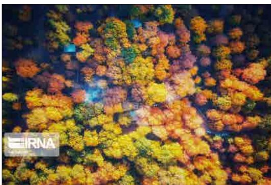
ایرنا - همدان - تصاویر، حال و هوای پاییزی باغ‌های دره و روستای سیلوار در دامنه کوه‌های الوند، روستای امامزاده کوه و منطقه گنج‌نامه در دره عباس‌آباد همدان را نشان می‌دهند. این مناظر بکر و زیبا بخشی از جاذبه‌های طبیعی استان همدان هستند. فاصله همدان تا پایتخت از روی نقشه حدوداً ۲۲۰ کیلومتر است