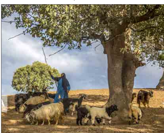
ایرنا - شهرکرد - پهنه رویشی زاگرس شامل رشته‌کوه‌های زاگرس، وسیع‌ترین و اصلی‌ترین رویشگاه گونه‌های مختلف بلوط در ایران بوده و به همین دلیل این منطقه از اهمیت بسیار ویژه‌ای برخوردار است