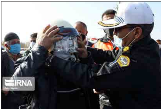
ایرنا - اصفهان - همزمان با هفته ایمنی حمل‌ونقل و روز جهانی پادمان قربانیان سوانح رانندگی، با همکاری پلیس راه روستایی و اداره کل راهداری و حمل‌ونقل جاده‌ای استان اصفهان و با هدف تشویق موتورسواران به استفاده از کلاه، توزیع رایگان کلاه ایمنی دیروز در محدوده پلیس راه اصفهان - شهرکرد انجام گرفت.