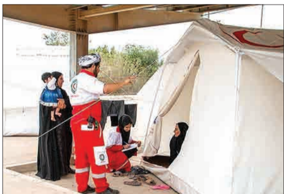
با افزایش سطح آب رودهای دز و کرخه و جاری شدن سیلاب در مناطق روستایی غرب و شرق رودخانه کارون، خانه‌ها تخلیه شده و مردم روستاها در کمپ و اردوگاه‌های هلال احمر و مدارس اسکان داده شده‌اند.