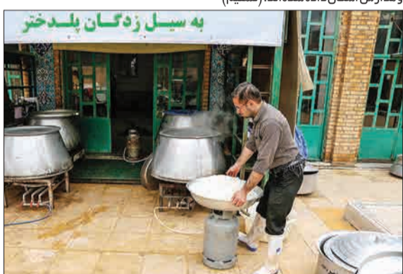
یکی از مهمترین مشکلات سیل‌زدگان عدم دسترسی به آذوقه و تهیه غذاست، به همین منظور گروهی از مردم به صورت جهادی وظیفه پخت و توزیع و تهیه غذا را برای هموطنان سیل‌زده در پلدختر برعهده گرفته‌اند. (میزان)