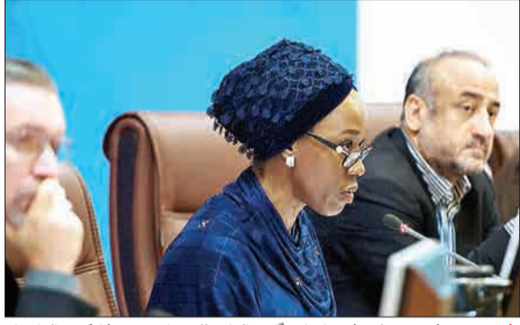
سومین نشست هم‌اندیشی با نمایندگان سازمان ملل درباره نحوه مشارکت سازمان‌های مردم‌نهاد سلامت در بحران سیل کشور، روز گذشته با حضور مدیرکل سازمان‌های مردم‌نهاد و خیرین وزارت بهداشت برگزار شد. (ایستنا)