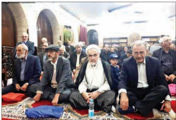
حسین شریعتمداری، عبدالله رمضانزاده و احمد منتظری در مراسم بزرگداشت سید محمود محتشمی‌پور از مبارزان قدیمی انقلاب اسلامی. (جماران‌نیوز)