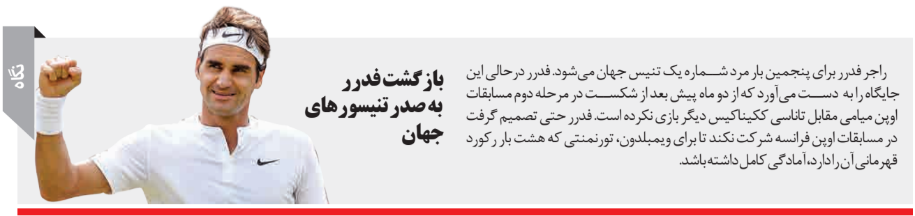
بازگشت فدرر به صدر تنیسورهای جهان

در روزهای پس از بروز یک حادثه، کودکان به حمایت و مراقبت بیشتری نیاز دارند. ممکن است خیلی بترسند و فشار زیادی به آنها وارد شده باشد.