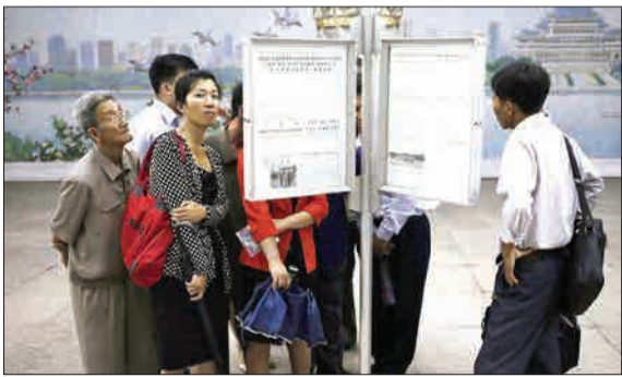
در این روش قدیمی و منسوخ، اخبار دیدار رئیس‌جمهور آمریکا و رهبر کره شمالی روی تابلویی در ایستگاه متروی شهر پیونگ‌یانگ به اطلاع مردم رسید.