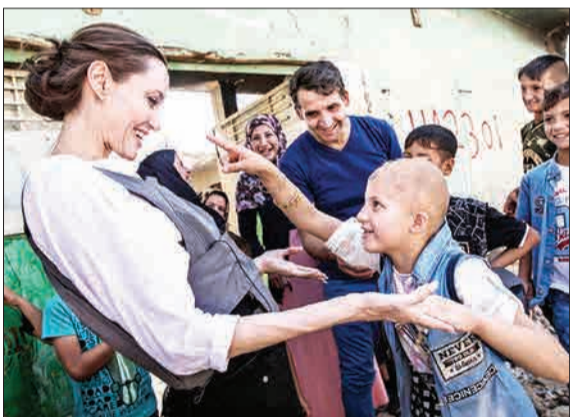
بازیگر هالیوود و نماینده ویژه کمیسیون عالی سازمان ملل در امور پناهنده‌ها در کمتر از یک‌سال پس از آژدی شهر موصل از گروه‌های تروریستی داعش، از این شهر بازدید کرد.