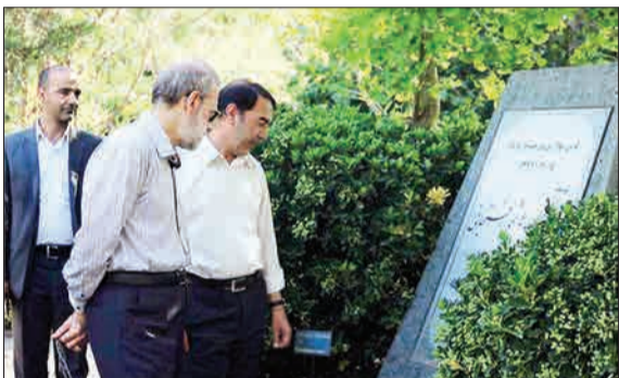
علی‌لاریجانی در حال تماشای درختی که مرحوم آیت‌الله هاشمی رفسنجانی در سال ۷۴ کاشته بود.