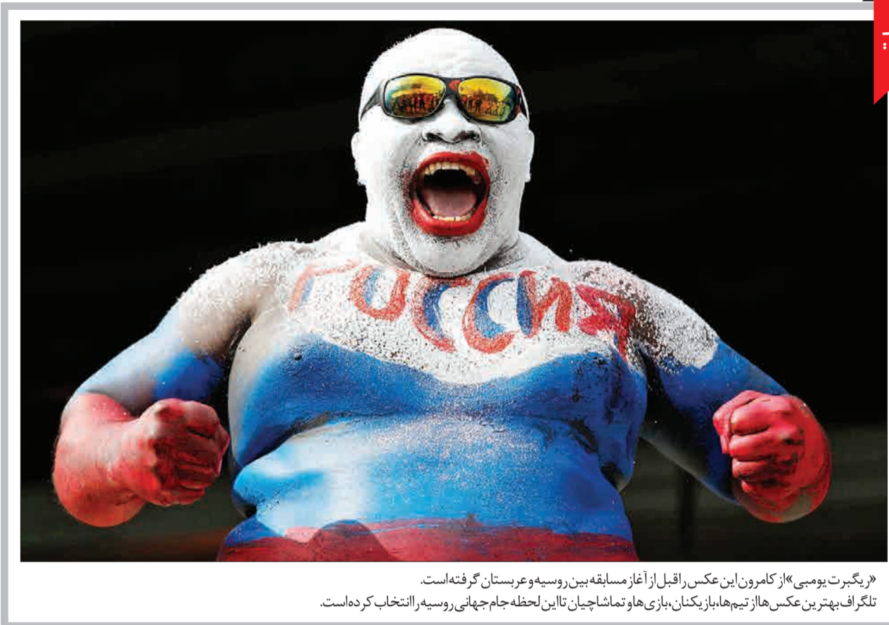
«ریگرت یومی» از کامرون این عکس را قبل از آغاز مسابقه بین روسیه و عربستان گرفته است. تلگراف بهترین عکس‌ها از تیم‌ها، بازیکنان، بازی‌ها و تماشاچیان تا این لحظه جام جهانی روسیه را انتخاب کرده است.