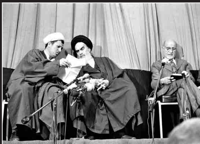
عباس عطار «عکاس صاحب‌نام ایرانی در گذشت»