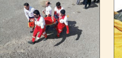
خستگی و سرمای بیش از حد در پایان یک روز پر استرس بر قله دنا خادقاوت امدادگر