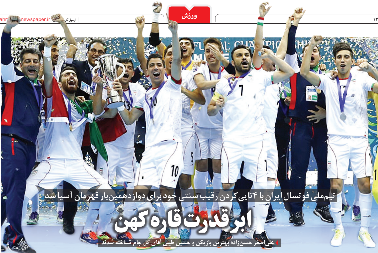
تیم ملی فوتبال ایران با ۴ تایی کردن رقیب سنتی خود برای دوازدهمین بار قهرمان آسیا شد