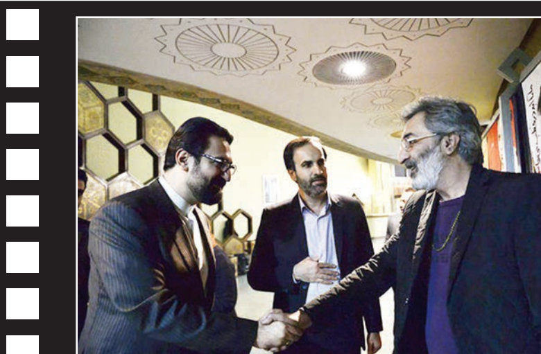
سیدمحمد مجتبی حسینی، معاون هنری وزیر فرهنگ و ارشاد اسلامی به همراه مهدی شفیعی، مدیرکل هنرهای نمایشی از مجموعه تئاتر شهر بازدید کرد.