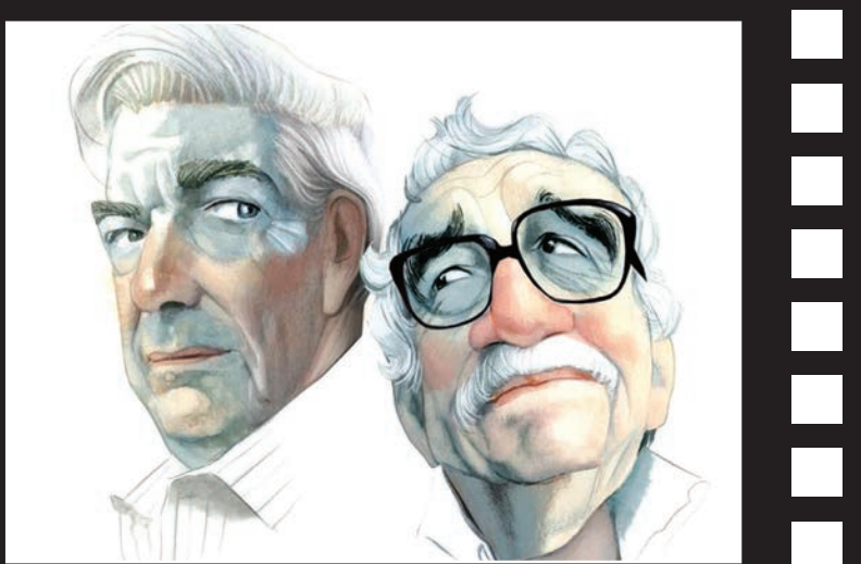
ماریو گاس بوسا، نویسنده پرویی برنده نوبل ادبیات بعد از یک دهه سکوت، در گفت‌وگو با روزنامه «ال پاپیس» از خاطر آتش با گابریل گارسیا مارکز، نویسنده فقید کلمبیایی سخن گفت.