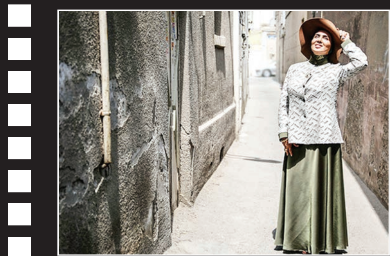
تولید مجموعه تلویزیونی «از یادها رفته» با حضور مدیر شبکه پنج سیما بازرگان و عوامل تولید این سریال آغاز شد.