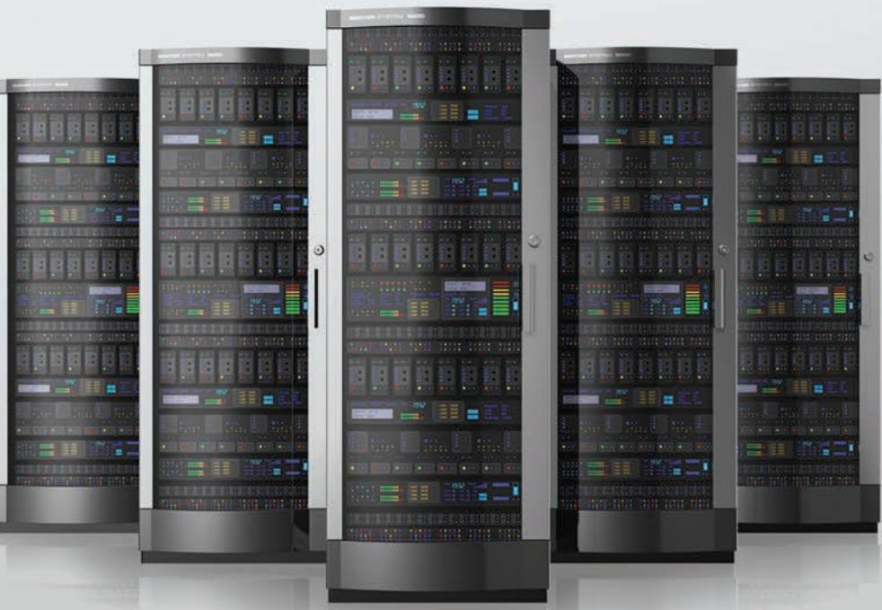
داری مجوز FCP به شماره ۱۶-۹۴-۱۰۰۰ از سازمان تنظیم مقررات و ارتباطات رادیویی