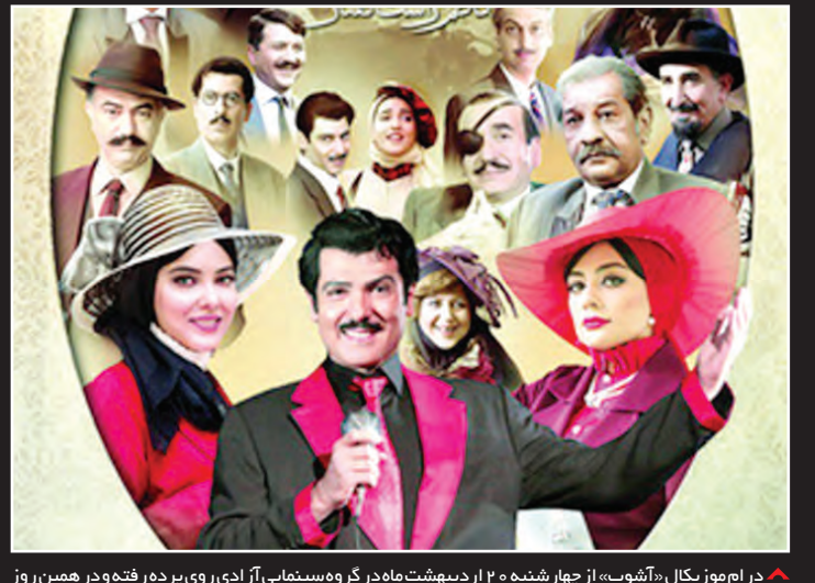
در ام‌وزیکال «آشوب» از چهارشنبه ۳۰ اردیبهشت ماه در گروه سینمایی آر‌دی روی پرده رفته و در همین روز مراسم افتتاحیه و نخستین اکران مردمی آن برگزار خواهد شد.

شهروند [شبه‌اچ‌بی] اعلام کرد به تازگی با چهار نویسنده مختلف برای تولید دنباله‌های احتمالی و مستقل بازی تاج و تخت قرارداد بسته است. این شبکه کابلی همچنین تأکید کرده است هنوز هیچ برنامه زمانی مشخصی برای تکمیل پروژه‌های یادشده وجود ندارد. چهار نویسنده شامل مکس بورنستاین، جین گلدمن، بریان هلگند و کارلی وری تیم نگارش دنباله‌های بعدی برپیننده‌ترین سریال تاریخ اچ‌بی‌و را تشکیل می‌دهند. گلدمن و وری هر کدام به‌طور جداگانه با مشورت جرج آر آر مارتن، رمان‌نویس و خالق قصه بازی تاج و تخت بر روی فیلمنامه‌های بعدی کار خواهند کرد. به گزارش وری، سخنگوی اچ‌بی‌و در توضیح