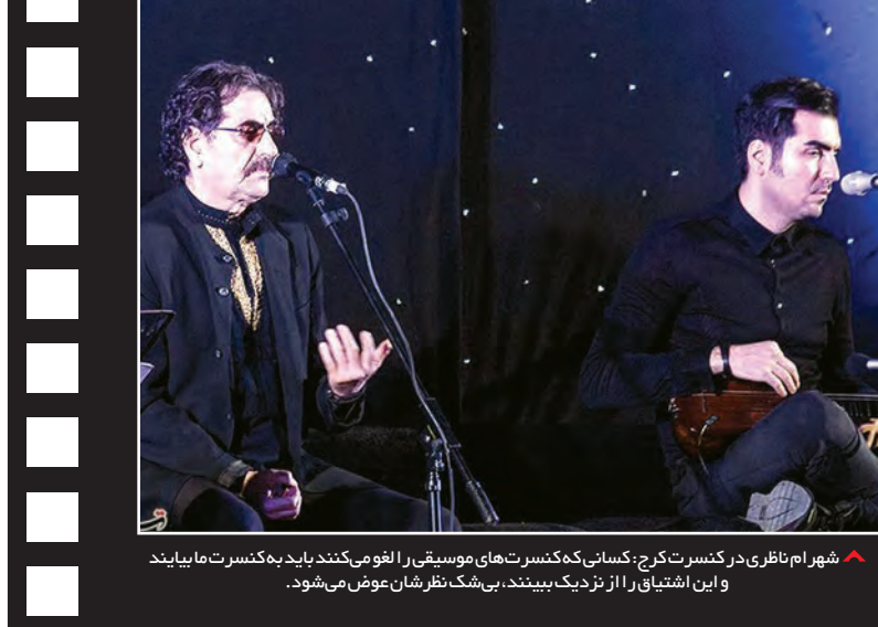
شهرام نظری در کنسرت کرج، کسانی که کنسرت‌های موسیقی را افوم می‌کنند باید به کنسرت ما بیایند و این اشتیاق را از نزدیک ببینند، بی‌شک نظرشان عوض می‌شود.