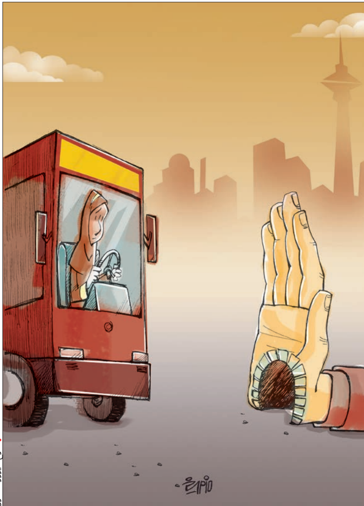
طرح: فیروز مظفری

به‌ناز مقدسی | زنانه و مردانه‌اش کرده‌ام؛ شغل‌ها و جایگاه‌های اجتماعی را می‌گویم. هر قدر هم که خودمان را مدافع حقوق زنان نشان دهیم، اما هنوز هم برای خیلی از ما باور کارهای مردانه و برابری زن و مرد در اجتماع سخت است؛ چرا؟! چون خیلی از ما منتظر نداریم اگر در اتاق مدیرعامل یک شرکت کار بازا کردیم، پشت میز یک زن نشسته باشد؛ هنوز نگاهمان به زنی که با خودرواش مسافرکشی می‌کند عجیب و غریب است و همین‌چنان زنی که آشپزی و خانه‌داری بلد نباشد از زن زندگی نمی‌دانیم. در ایران کنونی اگر چه جایگاه شغلی زنان به نسبت دهه‌های گذشته تغییر کرده و رئیس‌جمهوری از همان ابتدا نسبت به موانعی که باعث کاهش سهم زنان در مشارکت‌های سیاسی و اقتصادی شده بود، واکنش نشان داد اما این مشارکت‌ها آن قدر به کنده پیش می‌روند که هنوز سهم برابر زن و مرد را در جامعه ایرانی نمی‌توان به وضوح احساس کرد.