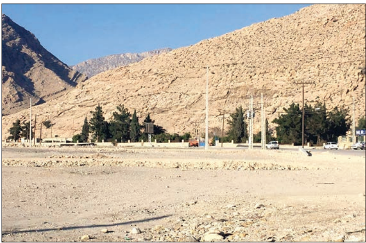
رأیه کمیسیون ماده ۵ دفتر فنی شهرداری اعلام کرده ولی توجیه به آن نشده است.

بر هم زدن استانداردهای حریم آب، تنها منبع آب آشامیدنی کازرون را در معرض آلودگی به فاضلاب قرار داد