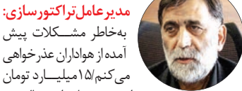
به خاطر مشکلات پیش آمده از هواداران عذرخواهی می‌کنم/ ۱۵ میلیارد تومان برای هزینه‌های امسال تیم

در اندزایی کردم به جز قلع‌قوعی با هیچ مربی دیگری کار نمی‌کنم/ از فیفا خواستیم مانند ژنرال مادرید پنجره نقل و انتقالاتی مارا نیز باز کند