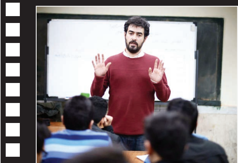
فروش فیلم، فروشنده، در آمریکا به یک میلیون دلار رسید.