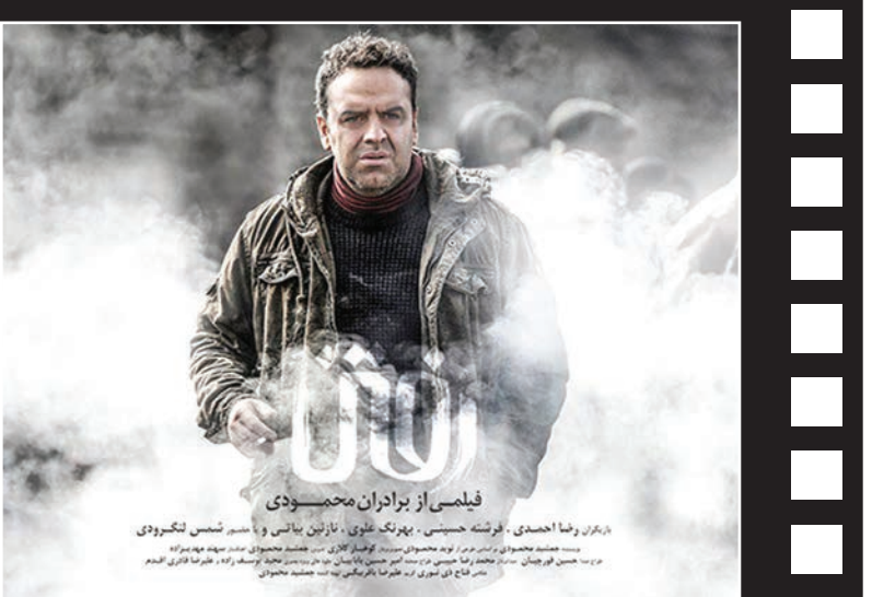
نمایشده افغانستان در مراسم اسکار که تهیه کننده و کارگردانش ایرانی هستند، نمایش جهانی خود را آغاز کرد