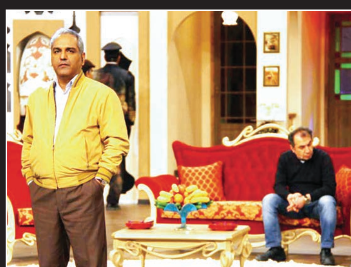
تهیه کننده، دور همی، اعلام کرد، حاشیه ها اجازه نمی دهند سر نوشت ادامه این برنامه مشخص شود.