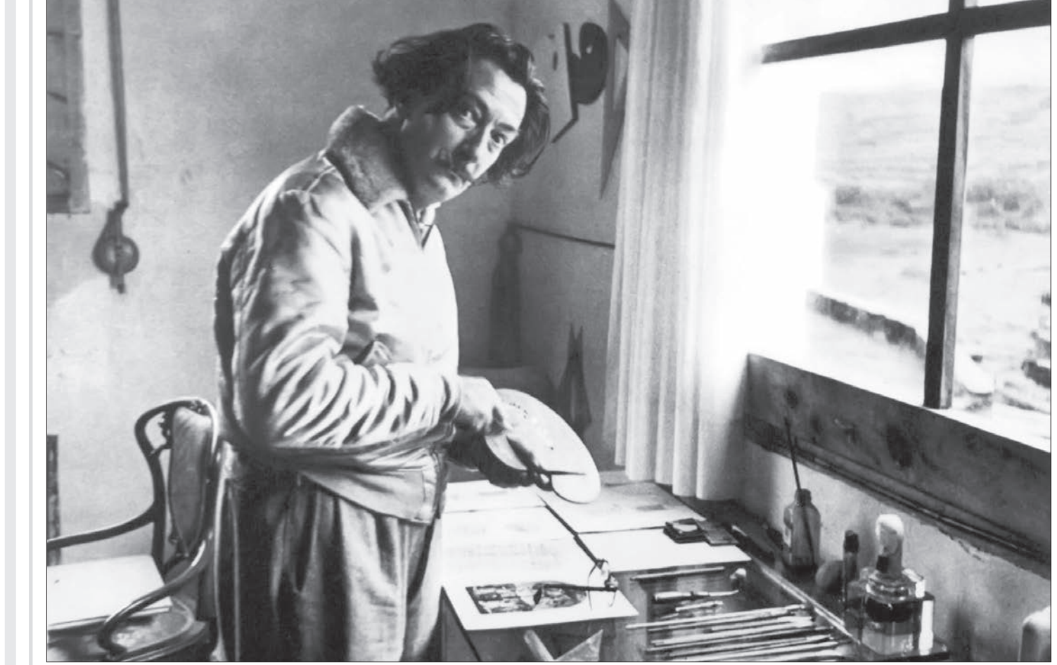
۲۸ سال پیش، برابر با بیست و سوم ژانویه ۱۹۸۹ میلادی، سالوادور دالی، نقاش سوررئالیست اسپانیایی در ۸۴ سالگی در گذشت. دالی طراحی ماهر بود که بیشتر به خاطر خلق تصاویر گیرا و خیالی در آثار سوررئالیستی (فرا واقع گر) خود به شهرت رسید. مهارت او در نقاشی اغلب به تاثیر نقاشان رئالیسم نسبت داده می‌شود. دالی همچنین در عکاسی، مجسمه‌سازی و فیلم‌سازی نیز فعالیت داشت. دالی همواره بر «ریشه عرب» خود تاکید داشت و ادعا می‌کرد که اجدادش به نسل «مور» یا «هاک جنوب اسپانیا» را برای تقریباً ۸۰۰ سال در اختیار داشتند، باز می‌گردند.

رخداد تأسیس حزب فاشیست ایتالیا با هدف احیای عظمت روم باستان توسط بنیتو موسولینی، روزنامه‌نگار و سیاستمدار (۱۹۱۹ میلادی) وقوع مرگ اورترین رازله تاریخ در شانشی چین با تلفاتی معادل ۸۲۰ هزار نفر (۱۵۵۶ میلادی) دریافت مدرک دکترای پزشکی از کالج پزشکی نیویورک توسط الیزابت بلکل، به عنوان نخستین پزشک زن در ایالات متحده آمریکا (۱۸۴۹ میلادی) امتناع هلند در برابر درخواست باز دادن ویلهلم دوم قیصر آلمان به متفقین در جنگ جهانی اول (۱۹۲۰ میلادی)