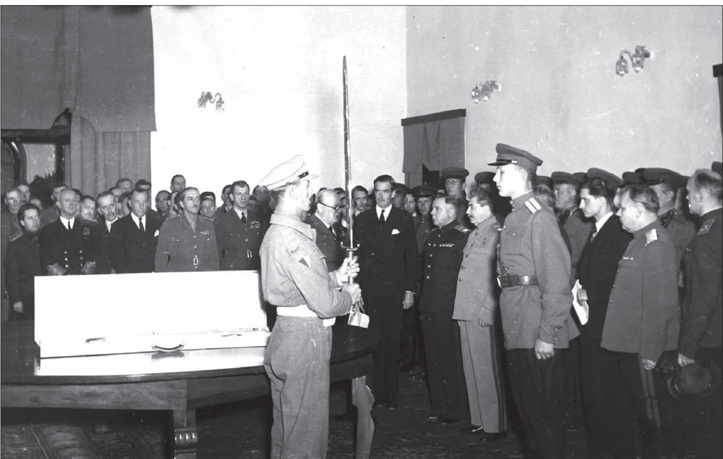
۷۲ سال پیش، برابر بیست و هفتم نوامبر ۱۹۴۳ میلادی، در دومین روز «کنفرانس تهران» که با حضور ژوزف استالین، ویستون چرچیل و تودور روزولت، رهبران اتحاد جماهیر شوروی، انگلستان و ایالات متحده آمریکا، در محوطه سفارت شوروی در تهران در حال برگزاری بود، چرچیل برای تقدیر از شجاعت ارتش سرخ اتحاد جماهیر شوروی در دفاع از شهر استالینگراد، یک شمشیر که به «شمشیر استالینگراد» شهرت یافت را به استالین اهدا کرد. کنفرانس تهران که در یک کتبی فاخره و پیش از کنفرانس‌های پتسدام و یالتا برگزار شد، روز نهم آذر، با صدور اعلامیه مشترکی که بارخود یاد داد، در بخشی از این اعلامیه، ضمن احترام به استقلال ارمنی ایران، موافقت شد تا نیروهای متفقین با فاصله پس از پایان جنگ، خاک ایران را تخلیه کنند.