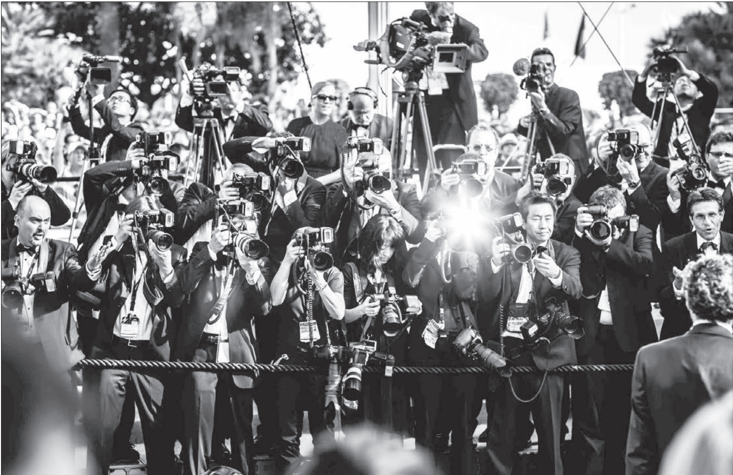
تجمع عکاس ها برای ثبت حضور ستاره های سینما روی فرش قرمز جشنواره فیلم کن [۷۷ سال پیش، برابر با نوزدهم سپتامبر ۱۹۳۹ میلادی، نخستین دوره جشنواره بین المللی فیلم کن در شهر ساحلی کن در جنوب فرانسه آغاز به کار کرد. برگزار این جشنواره به مدت ۶۰ سال یعنی تا پایان جنگ جهانی دوم در ۱۹۴۶ میلادی متوقف ماند. این رویداد سینمایی معتبر در سال های ۱۹۴۸ و ۱۹۵۰ به علت مشکل بودجه برگزار نشد و از سال ۱۹۵۱ زمان برگزاری آن به فصل بهار منتقل شد. تا سال ۱۹۵۴ جایزه ای تحت عنوان «جایزه بزرگ جشنواره کن» به برنده بهترین فیلم این رویداد سینمایی اعطا می شد اما در اواخر سال ۱۹۵۴ هیات مدیره جشنواره کن گروهی از جوایز را از این برای طراحی جایزه ای ویژه معرفی کرد که در نهایت لوپنیلانژون جوایز ساز پارسی پیش نهاد استفاده از یک نگل کسمبیل شهر کن بود. این پیشنهاد هم در اوقات قرار گرفت و از سال ۱۹۵۵ جایزه نخل طلا جایگزین جایزه بزرگ این جشنواره شد.