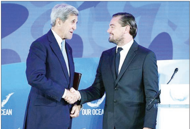
این پروژه ۱۰ میلیون دلاری توسط شرکت گوگل، تروث (SkyTruth) و گروه حفاظت دریایی Oceanica پشتیبانی می‌شود.

لئوناردو دی‌کاپریو بازیگر مطرح هالیوود با همکاری شرکت گوگل برای راه‌اندازی یک سیستم نظارتی مبتنی بر ماهواره در جهت جلوگیری از ماهیگیری غیرقانونی سرمایه‌گذاری کرده است. به گزارش ایسنا، این هنرپیشه محبوب که سابقه درینمای در فعالیت‌های بشردوستانه دارد، در حدود ۵ میلیون دلار برای انجام این پروژه‌ها اهدا کرده است. این فناوری که به صورت آنلاین بوده، امکان نظارت آنلاین بر فعالیت‌هایی که در قایق‌های ماهیگیری را، به‌منظور مبارزه با صید بی‌رویه در سراسر جهان فراهمی‌کند. این سیستم ماهواره‌ای قادر است موقعیت و مسیر ناوگان تجاری ماهیگیری را مشخص و همچنین پیش از ۲۵ هزار کشتی را به صورت آنلاین بر نظر نظارت ماهیگیری غیرقانونی رصد کند. این فناوری که «دبیدان جهانی ماهیگیری» (Global Fishing Watch) نام دارد، برای نظارت مداوم ماهواره‌ای از آسمان روی فعالیت‌های ماهیگیران طراحی شده است. با راه‌پایه این فناوری و آنلاین داده‌های به دست آمده، فعالان حفاظت از دریا، شهروندان را تشویق می‌کنند تا در دنبال کردن نظارت بر فعالیت‌های غیرقانونی نقش داشته باشند. دی‌کاپریو در مراسم رونمایی از این سامانه در وزارت امور خارجه آمریکا در واشنگتن گفت: این فناوری بی‌سابقه در سراسر جهان برای همه در دسترس است. ذخایر ماهی در بسیاری از نقاط جهان پس از بهره‌برداری بیش از حد کاهش چشمگیری پیدا کرده و حتی با وجود توافقنامه‌های بین‌المللی، بسیاری از ماهی‌ها هنوز به‌طور غیرقانونی صید می‌شوند که این امر بسیار نگران‌کننده است. متأسفانه در حدود دوسوم از ذخایر ماهی جهان به صورت غیرقانونی و بی‌رویه صید شده و میزان بهره‌برداری غیرقانونی از آن، بیش از ظرفیت است.