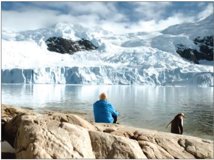
نمایش از فیلم «خ و آسمان»