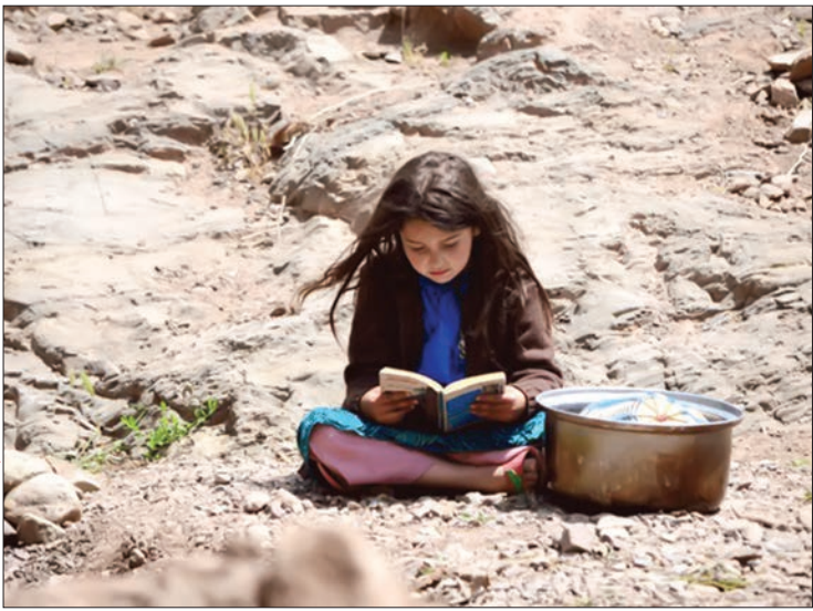
نمایش از فیلم «خ و آسمان»