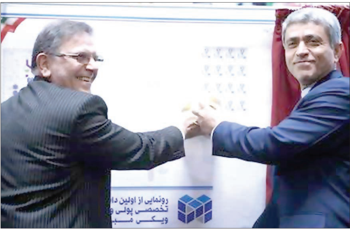
وزیر اقتصاد و رئیس کل بانک مرکزی در مراسم رونمایی از «مینا»

از ایجاد زبان مشترک، یکپارچگی فرآیندها، تولید دانشنامه بانکی، تطابق نظام بانکی کشور با چارچوب‌های بین‌المللی بانکداری و تدوین مدل‌های مرجع نام برد که با مشارکت خبرگان بانکی و فناوری کشور گردآوری و مستندسازی خواهد شد.